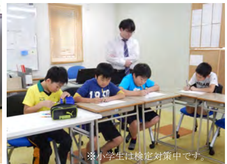
※小学生は検定対策中です。